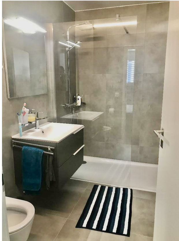
Salle de douche